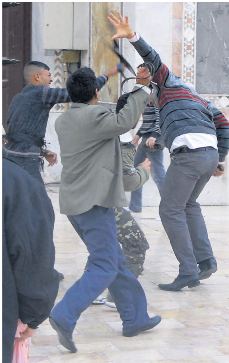
DAMAS (SYRIE), HIER. Des anti et des pro-gouvernementaux se sont affrontés devant la mosquée des Omeyyades après la prière.