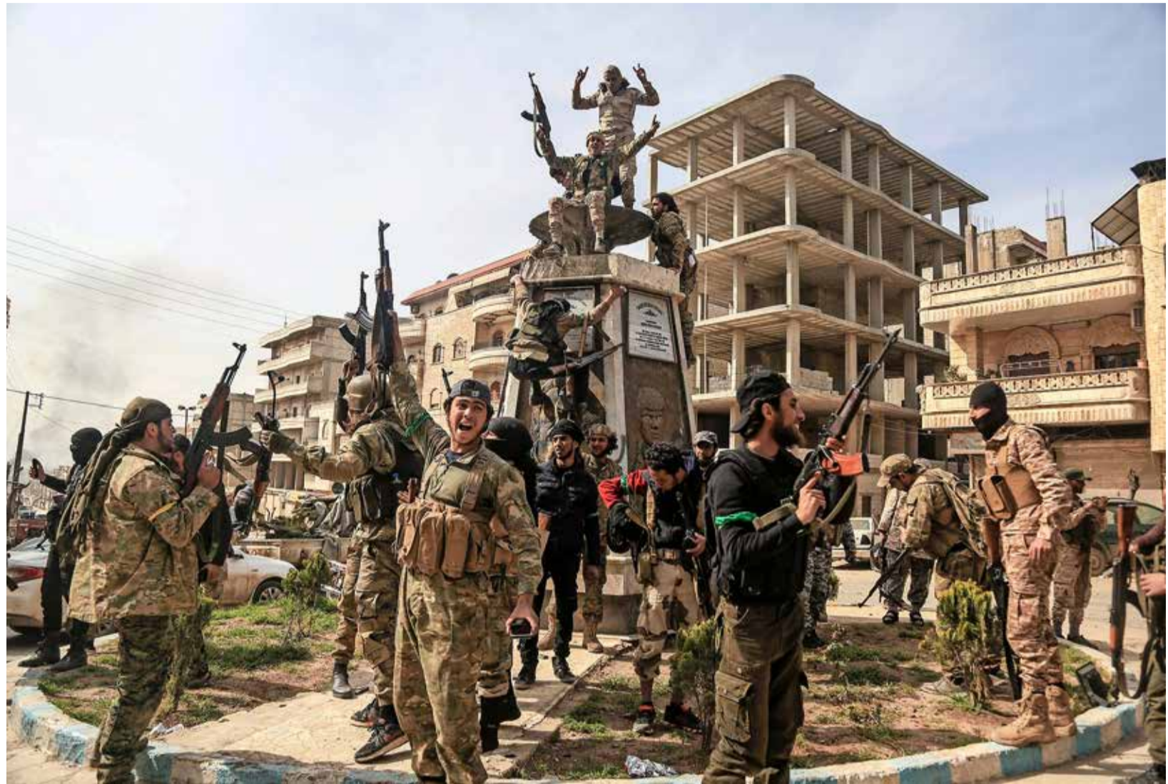
La ville d'Afrine, en zone kurde, a été prise dimanche par des militaires turcs et leurs supplétifs syriens. Keystone

La Turquie a négocié la prise de Manbij avec Rex Tillerson. Mais le limogeage la semaine dernière du secrétaire d'Etat américain a changé la donne. Les Turcs sont en train de négocier le sort de Manbij avec son remplaçant, Mike Pompeo.